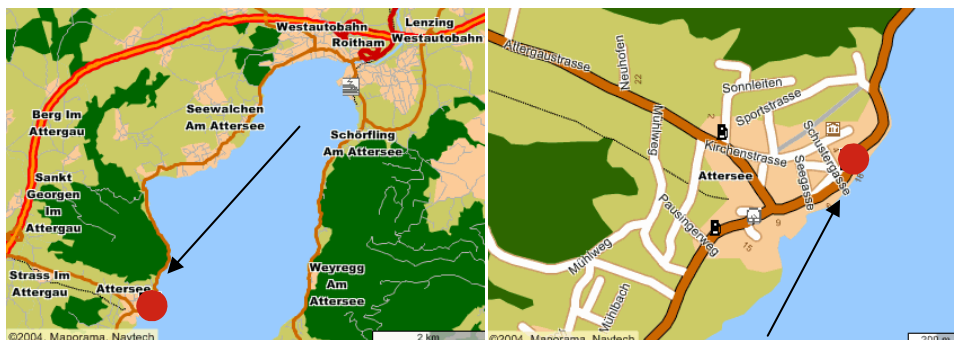
A1 - Abfahrt St. Georgen – ca. 3 km Attergaustraße bis Attersee

Tel: +43(7666)78640 Fax: +43(7666)786491 E-Mail: hoteloberndorfer@attersee.at www.oberoesterreich.at/oberndorfer