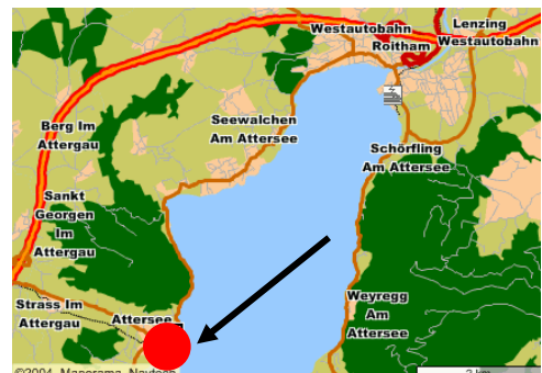
A1 - Abfahrt St. Georgen - ca. 3 km Attergaustraße bis Attersee

Tel: +43(7666)78640 Fax: +43(7666)786491 E-Mail: hoteloberndorfer@attersee.at www.oberoesterreich.at/oberndorfer